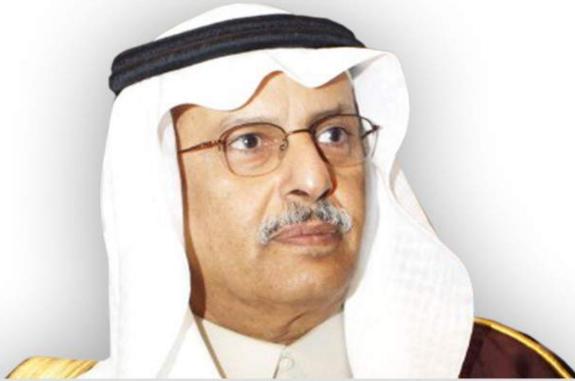
معالي وزير الزراعة د فهد بن عبدالرحمن بالغنيم

وقد ضم المجلس خمسة اعضاء من ابرز قيادات الاستزاع المائي في المملكة من المستثمرين والاداريين والذي يحضون بحضور بارز في القطاع ولهم اسهامات واضحة في دعم الاستزاع المائي في المملكة العربية السعودية.