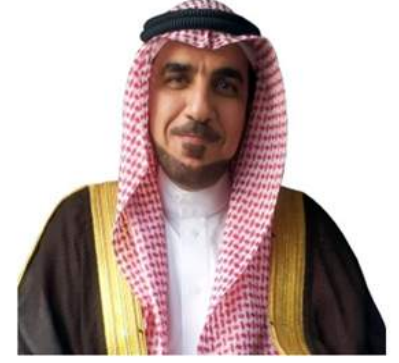
م. احمد بن رشيد البلاء رئيس مجلس إدارة الجمعية السعودية للإستزراع المائي